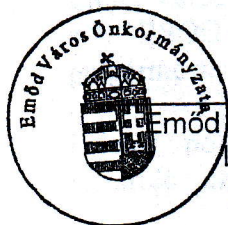
Emőd Város Önkormányzata Lehóczki István polgármester

BORSODVÍZ ÖNKORMÁNYZATI KÖZÜZEMI SZOLGÁLTATÓ ZÁRTKÖRŰEN MŰKÖDŐ RÉSZVÉNYTÁRSASÁG